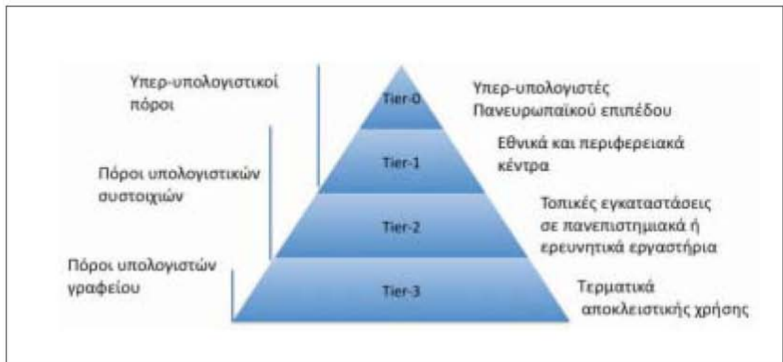
Σχήμα 1 - Ιεραρχία υπηρεσιών ΥΥΕ

• Η προσωπικοί υπολογιστές, σταθμοί εργασίας ή τερματικά (Tier-3), τα οποία παρέχονται