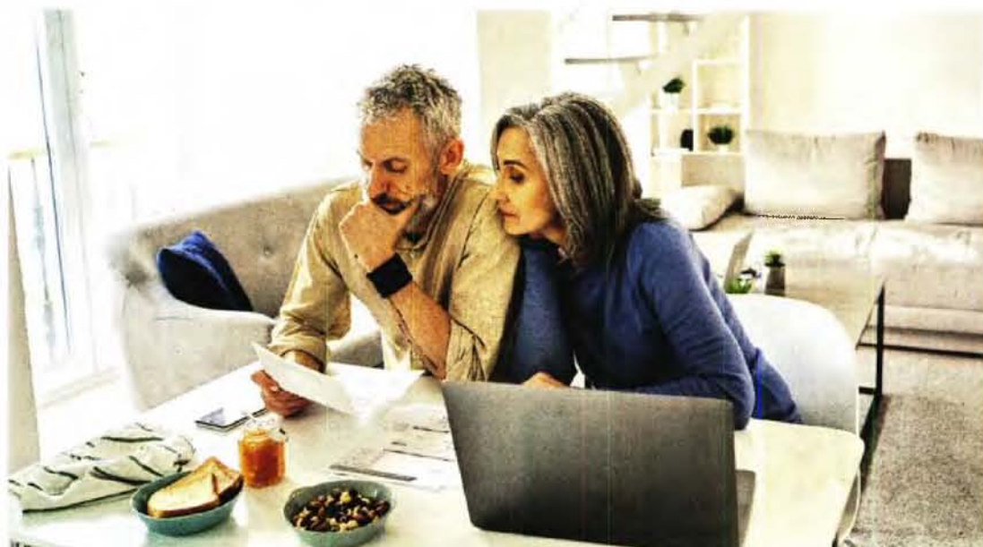
Οι αποταμιεύσεις μας μπορούν να καλύψουν τεκμήρια και να μας γλιτώσουν από έξτρα φόρους.

ΓΙΩΡΓΟΣ ΠΑΛΑΙΤΣΑΚΗΣ gpalaitsakis@e-typos.com