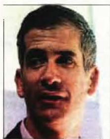
Τι αναφέρουν για τον διαγωνισμό σχετικά με έργα ανάπλασης δημοσίων χώρων

όρους «δεν διασφαλίζεται ούτε ο επαρκής ανταγωνισμός ούτε το όφελος του Δημοσίου ούτε εν τέλει η επίδοση, τουλάχιστον, της νομιμότητας». Στον ΣΑΤΕ ζητούν την άμεση ακύρωση της συγκεκριμένης διακήρυξης. Σύμφωνα με τη διοίκηση του εργοληπτικού συνδέσμου για τη συμμετοχή στον μεγάλο διαγωνισμό του Δήμου Αθηναίων απαιτείται οι υποψήφιοι «να είναι κερδοφόροι για έκαστη εκ των τριών (3) δημοσιευμένων οικονομικών χρήσεων για τα έτη 2016, 2017, 2018». Ζητείται, επίσης, να έχουν μέσο ετήσιο κύκλο εργασιών για τις τελευταίες χρήσεις που να είναι ίσος ή ανώτερος του 50% του προϋπολογισμού, δηλαδή να κινείται σε επίπεδα άνω των 15.000.000 ευρώ. Μάλιστα, σε περίπτωση κοινοπραξίας, η συγκεκριμένη απαίτηση «οφείλει να καλύπτεται αθροιστικά από όλα τα μέλη» της κοινοπραξίας. Απαιτείται, επίσης, να έχουν κατά την τελευταία χρήση με δημοσιευμένα οικονομικά στοιχεία, δηλαδή το 2018, ίδια κεφάλαια άνω των 10.000.000 ευρώ, ενώ ο λόγος (ίδιων κεφαλαίων προς σύνολο υποχρεώσεων να είναι μεγαλύτερος του 1,1 για την ίδια χρήση.