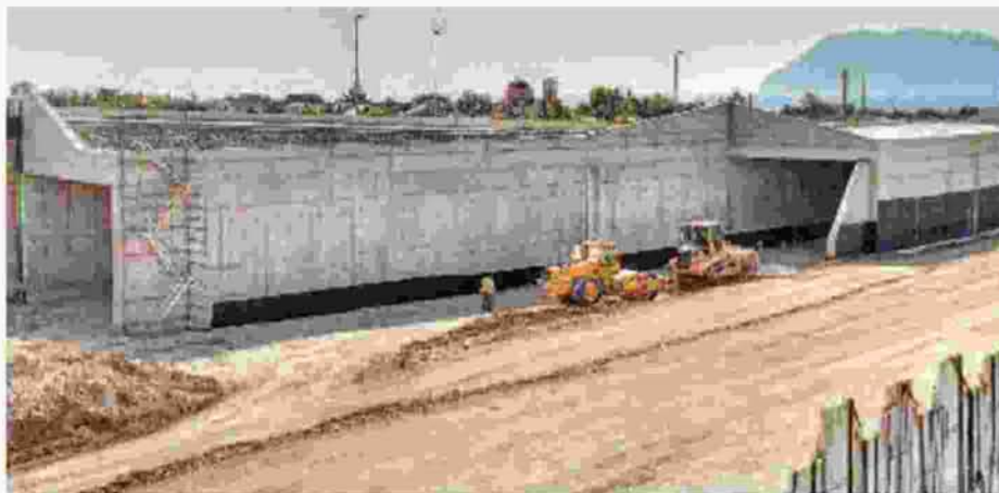
Το σύνολο των εργοληπτικών επιχειρήσεων όλων των κατηγοριών, από την 3η ως την 7η τάξη, το 2005 έφτανε τις 681, ενώ σήμερα υπάρχουν 453

Με βάση τα επίσημα στοιχεία της Ελληνικής Στατιστικής Αρχής, την τριετία 2004-2006 ο κατασκευαστικός τομέας συμμετείχε κατά 8,3% στη διαμόρφωση του ΑΕΠ, ενώ την τελευταία τριετία 2014-2016 δεν ξεπερνά το 2,1%. Άμεση συνέπεια ήταν κάθεται μείωση των θέσεων εργασίας, οι οποίες σήμερα μόλις φθάνουν τις 183.500 και παρουσιάζουν μείωση 45% σε σχέση με τις 400.000 που είχαν καταγραφεί το 2008. Την ίδια πτωτική τάση εμφανίζουν και οι εργοληπτικές εταιρείες, όπως προκύπτει από τις καταγραφές του Μητρώου Εργοληπτικών Επιχειρήσεων (ΜΕΕΠ). Το σύνολο των εργοληπτικών επιχειρήσεων όλων των κατη-