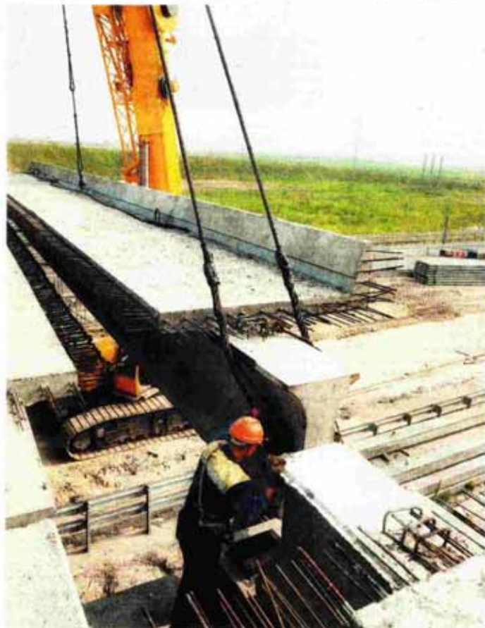
Τα έργα που λόγω έλλειψης χρηματοδότησης δεν θα ολοκληρωθούν ως το τέλος του 2015 και δεν θα είναι επιλέξιμα στο νέο ΕΣΠΑ, θα πρέπει είτε να χρηματοδοτηθούν από ένα Ελληνικό Δημόσιο που δεν διαθέτει πόρους είτε να διακοπούν και να επιστραφεί στην ΕΕ το σύνολο των χρηματοδοτήσεων που έχουν ληφθεί γ' αυτά

Το κόστος τους όμως το επιμόσμησαν πλήρως. Τι θα συνέβαινε άραγε στους κλάδους του ελαιολάδου και των γαλακτοκομικών προϊόντων αν δεν πληρωνόταν ούτε ένα ευρώ από τις εξαγωγές τους; Για πόσο καιρό θα μπορούσαν να αντέξουν και να παραμείνουν οι επιχειρήσεις των κλάδων αυτών ανοιχτές σε τέτοιες ανάγκες συντήρησης; Γι' αυτό ο ΣΑΤΕ δικαίως αγωνιά και ζητεί από τους πολιτικούς και τα κόμματα να αναλάβουν τις ευθύνες τους.