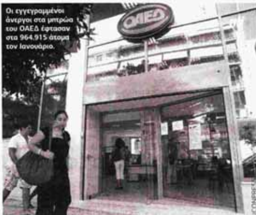
Οι εγγεγραμμένοι άνεργοι στα μητρώα του ΟΑΕΔ έφτασαν στα 964.915 άτομα τον Ιανουάριο.

Νοέμβριο του 2011 (τον τελευταίο μήνα σε σχέση με τον οποίο έχουν δοθεί επίσημα ποσοστά από την Ελληνική Στατιστική Αρχή) μέχρι και τον