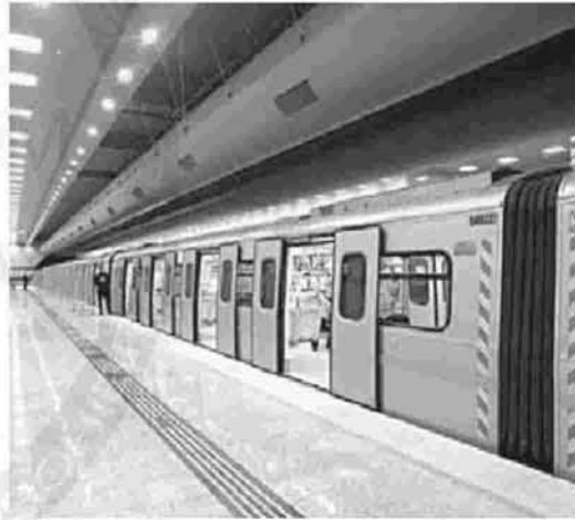
Αιτία του προβλήματος, οι μεγάλες καθυστερήσεις στην ολοκλήρωση των υπό κατασκευή σταθμών το μετρό.