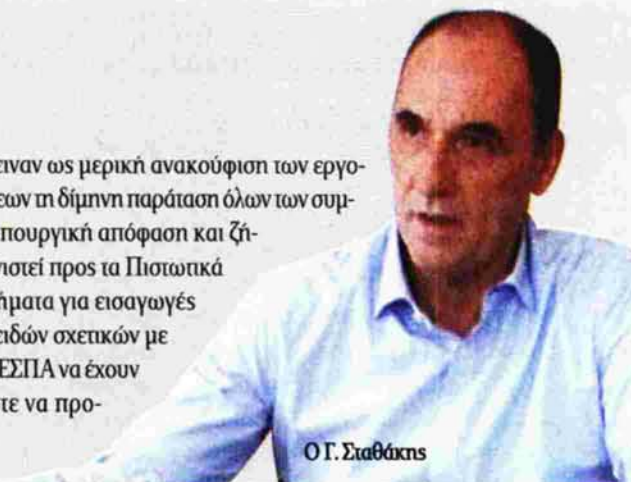
Ο Γ. Σταθάκης

ποι του ΣΑΤΕ πρότειναν ως μερική ανακούφιση των εργοληπτικών επιχειρήσεων τη δίμηνη παράταση όλων των συμβάσεων έργων με υπουργική απόφαση και ζήτησαν να αποσαφηνιστεί προς τα Πιστωτικά Ιδρύματα ότι τα αιτήματα για εισαγωγές υλικών, και άλλων ειδών σχετικών με την εκτέλεση έργων ΕΣΠΑ να έχουν προτεραιότητα, ώστε να προχωρήσουν τα έργα.