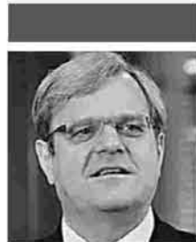
Του Thomas Maier

Copyright: Project Syndicate, 2015. www.project-syndicate.org