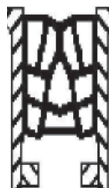
Σχήμα 2 – Απεικόνιση αρχικής κατάστασης υλικού πλήρωσης σε σχέση με αντίστοιχο τοποθετημένο και πλήρως συμπιεσμένο