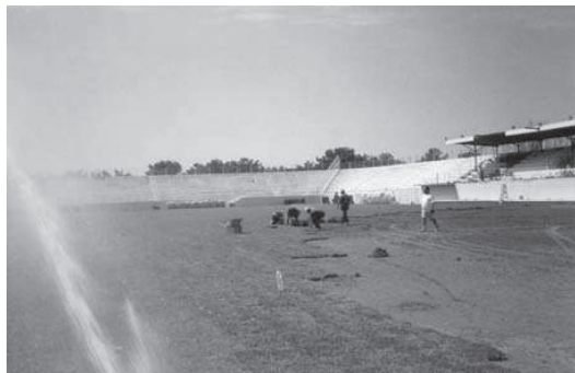
Εικόνα 2 - Διάστρωση έτοιμου χλοοτάπητα.