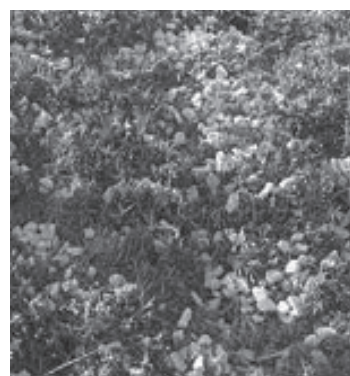
Εικόνα 2 - Επιφάνειες εγκαταστημένου μεσημβριάνθεμου.