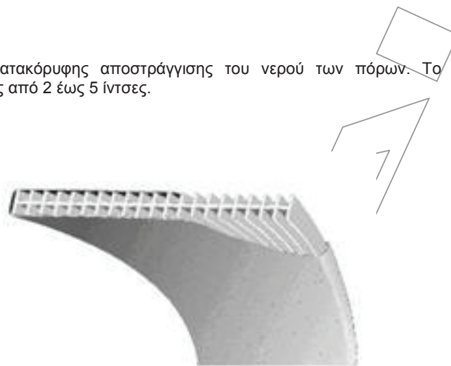
Σχ. 1 - Τυπική τομή φιλτροταινίας.

πυρήνας αποτελεί την δίοδο κατακόρυφης αποστράγγισης του νερού των πόρων. Το πλάτος των φιλτροταινιών κυμαίνεται συνήθως από 2 έως 5 ίντσες.