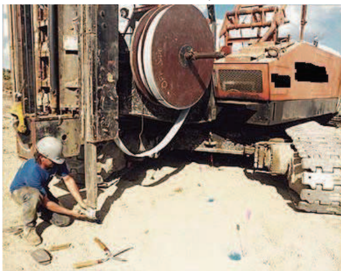
Σχ. 3 - Εξοπλισμός τοποθέτησης κατακόρυφων στραγγιστηρίων.

Είναι δυνατή η χρήση συστημάτων ταυτόχρονης έμπηξης πολλαπλών συνθετικών στραγγιστηρίων, με την χρήση κατάλληλου πλαισίου στήριξης πολλαπλών στελεχών και ισχυρού συστήματος εφαρμογής πίεσης ή δονητού ικανής ισχύος. Στην περίπτωση αυτή ισχύουν όλες οι ανωτέρω διατάξεις της παρούσης προδιαγραφής για συστήματα απλής (μεμονωμένης) έμπηξης συνθετικών στραγγιστηρίων.