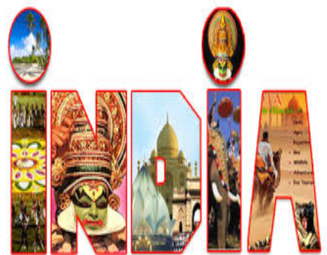
Κρατική διαφήμιση για τον ινδικό τουρισμό

τουρισμό, που ανέρχεται σε 10-12% του συνολικού τουρισμού, γεγονός που σημαίνει ότι η κρίση εντοπίζεται στο υπόλοιπο κομμάτι του τομέα. Τονίζουν, δε, ότι η Ινδία έχει μεγάλο ανταγωνισμό από τις γειτονικές σε αυτή χώρας, που επίσης αποτελούν εξωτικούς προορισμούς για Ευρωπαίους και Αμερικανούς, αλλά δεν