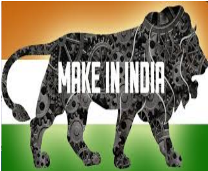
Το σύμβολο του φιλόδοξου προγράμματος “Make in India”

Σε μια προσπάθεια προώθησης του επιχειρείν στον αμυντικό τομέα, ο Ινδός Υπουργός Άμυνας εγκαινίασε την 21 η Δεκεμβρίου μια νέα ιστοσελίδα και υποσχέθηκε ότι θα επισπευστεί η αναθεώρηση της διαδικασίας προμηθειών, η οποία αναμένεται να ολοκληρωθεί τον Ιανουάριο 2016. Πρόκειται για την ιστοσελίδα