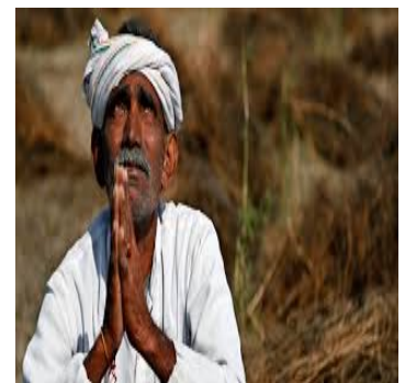
Ινδός αγρότης προσεύχεται να βρέξει

ένα έτος νωρίτερα. Η έκθεση αναφέρει ως κύριους λόγους για το φαινόμενο την πτώχευση ή υπερχρέωση των αγροτών, τα προβλήματα που συνδέονται με την παραγωγή (μη απόδοση της σοδειάς, καταστροφή της παραγωγής λόγω φυσικών φαινομένων, αδυναμία