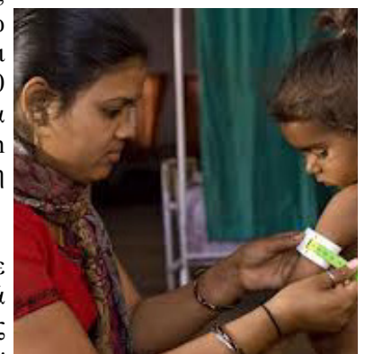
Μεγάλος αριθμός μη κανονικά ανεπτυγμένων παιδιών