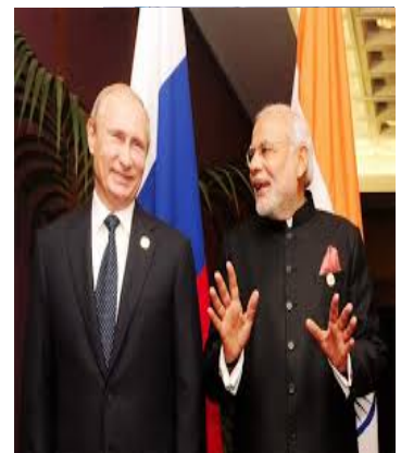
Ο Ινδός Πρωθυπουργός Narendra Modi με τον Ρώσο Πρόεδρο Vladimir Putin στην πρόσφατη επίσκεψη του πρώτου στη Μόσχα

7. Μνημόνιο Κατανόησης μεταξύ GLONASS και Centre for Development of Advance Computing για συνεργασία σε εμπορικές εφαρμογές μέσω