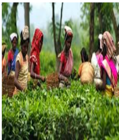
Φυτεία τσαγιού στη Νότιο Ινδία

σχολιαστές, η Ινδία πρέπει να εφαρμόσει σειρά οικονομικών μεταρρυθμίσεων, ώστε η οικονομία της να καταστεί ανταγωνιστική, για να μπορέσει στο μέλλον να επωφεληθεί από ανάλογες συμφωνίες. Σημειώνεται, ότι η TPP φιλοδοξεί να γίνει η μεγαλύτερη ζώνη ελεύθερου εμπορίου, εκπροσωπώντας το 40% της παγκόσμιας