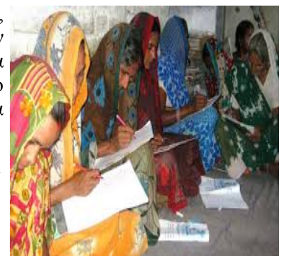
Πρόγραμμα διδασκαλίας γραφής