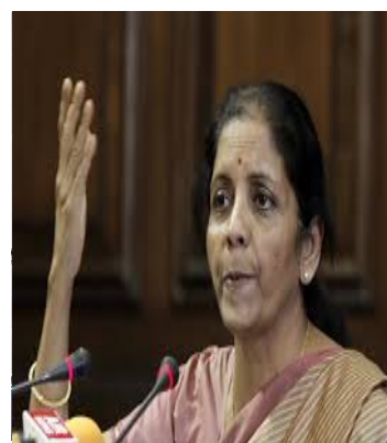
Η Υπουργός Εμπορίου & Βιομηχανίας της Ινδίας, κα Nirjala Sitharaman

Η Υπουργός Εμπορίου, κα Nirjala Sitharaman, δήλωσε στην ίδια συνεδρίαση, ότι η Ινδία είχε υποστήριξη από πολλές αναπτυσσόμενες και φτωχές χώρες, αλλά ότι λίγες ανεπτυγμένες χώρες, συμπεριλαμβανομένων των ΗΠΑ, αντιτάχθηκαν στη συνέχιση του Γύρου της Ντόχα.