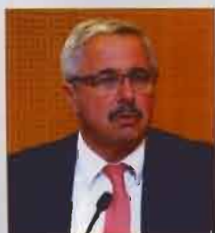
Ο βουλευτής Αργολίδας και επικεφαλής Τομέα Διπρόσωπων Υποδομών & Μεταφορών του ΚΙΝ.ΑΛ. κ. Γιάννης Μανιάτης.