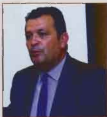
Ο βουλευτής Μαγνησίας και αναπληρωτής υπεύθυνος Τομέα Υποδομών ΝΔ κ. Χρήστος Μπουκώρος.