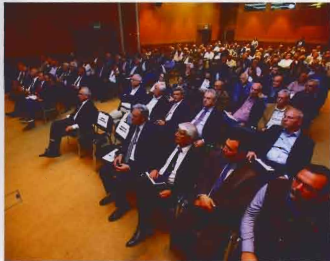
ΣΑΤΕ Γ. ΒΛΑΧΟΣ: ΕΛΛΕΙΜΜΑ ΔΙΑΦΑΝΕΙΑΣ

Οι τρεις φορείς είχαν δεσμευθεί από το Μνημόνιο Συναντίληψης και Συνεργασίας της 5/12/2018 ότι θα υποβάλουν τις συγκεκριμένες προτάσεις με στόχο την άμβλυση και επίλυση σημαντικών προβλημάτων στις διαδικασίες ανάθεσης και εκτέλεσης μελετών και έργων που παρατηρούνται τα τελευταία χρόνια (θέματα διαφάνειας, ισότιμου και υγιούς ανταγωνισμού).