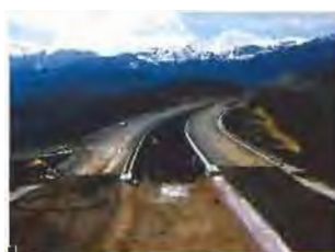
Εικόνα από εθνικό οδικό άξονα υπό κατασκευή.

γ) Οι εγγεγραμμένες στο ΜΕ-ΕΠ εργοληπτικές εταιρείες 3ης έως 7ης τάξης μειώθηκαν κατά 25% την περίοδο 2004 - 2011 και 31% την περίοδο 2011 - 2018, με αποτέλεσμα από τις 712 εργοληπτικές εταιρείες 3ης έως 7ης τάξης που υπήρχαν το 2004 να έχουν μείνει το 2018 μόλις 369, δηλαδή λιγότερες απ' τις μισές.