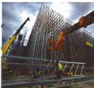
Ανέγερση κτιριακού συγκροτήματος.

Επιπλέον, θεωρούμε ότι έχει ωριμάσει η ανάγκη διενέργειας αντίστοιχων ποιοτικών ελέγχων και στα ιδιωτικά έργα. Γενικά, μπορούμε να πούμε ότι το σύστημα ποιοτικών ελέγχων έχει βελτιωθεί ακόμα όμως υπάρχουν σημαντικά περιθώρια βελτίωσης. ΕΘ