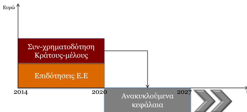
Σχήμα 1: Ανακύκλωση κεφαλαίων μέσω χρήσης χρηματοδοτικών εργαλείων

Η χρήση χρηματοδοτικών εργαλείων έχει μακροπρόθεσμη προοπτική, καθώς τα κεφάλαια που επιστρέφονται μέσω των χρηματοδοτικών εργαλείων μπορούν να επαναχρησιμοποιηθούν για περαιτέρω επενδύσεις, προωθώντας τη βιωσιμότητα και μακροχρόνια ανακύκλωση των δημόσιων κεφαλαίων. Πέραν της μακροπρόθεσμης αξιοποίησης των ανακυκλούμενων κονδυλίων, τα χρηματοδοτικά εργαλεία θα βοηθήσουν στην αντιμετώπιση αδυναμιών της αγοράς, μέσω κινητοποίησης επιπρόσθετων δημόσιων ή ιδιωτικών επενδύσεων, σε ευθυγράμμιση με την πολιτική συνοχής και τους στρατηγικούς στόχους της Ευρώπης για την προγραμματική περίοδο 2014-2020.