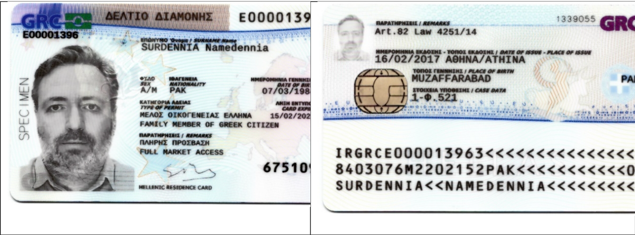
Δείγμα Δελτίου Διαμονής μέλους οικογένειας πολίτη ΕΕ