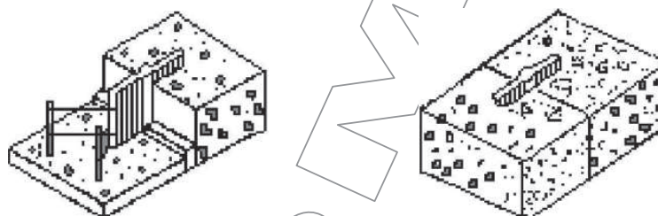
Σχήμα 2 – Τοποθέτηση στεγανωτικής ταινίας για την οποία απαιτείται σχισμή στον ξυλότυπο

Για την εφαρμογή των στεγανωτικών ταινιών απαιτείται κατάλληλα διαμορφωμένη εγκοπή στον ξυλότυπο για να υποδεχθεί την πλευρά της στεγανωτικής ταινίας. Εναλλακτικά μπορούν να χρησιμοποιηθούν στεγανωτικές ταινίες με σχισμή.