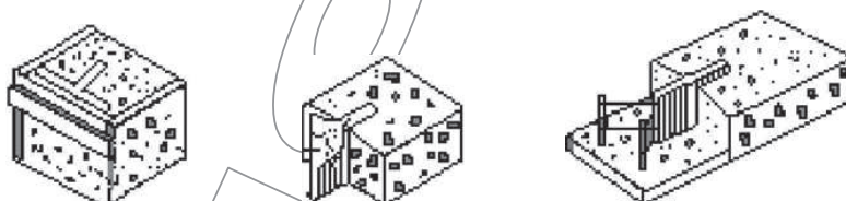
Σχήμα 3 – Στεγανωτική ταινία με σχισμή στην μία πλευρά για την τοποθέτηση της οποίας δεν απαιτείται ιδιαίτερη διαμόρφωση του ξυλότυπου. Μετά την αφαίρεση του ξυλότυπου γίνεται σύνδεση των δύο πτερυγίων μεταξύ τους και ακολουθεί η επόμενη φάση σκυροδέτησης.

Η εργασία τοποθέτησης των ταινιών θα εκτελείται με επιμέλεια ώστε να μην προξενείτε φθορά ή / και αλλοίωση και να προφυλάσσονται κατά την πρόοδο των εργασιών μέχρι την τελική κάλυψή τους και σφράγιση των αρμών.