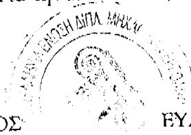
ΕΥΑΓΓΕΛΟΣ Θ. ΚΑΣΣΕΛΑΣ