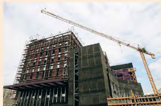
Το φαινόμενο των καθυστερήσεων είναι πλέον μια κανονικότητα, η οποία «στραγγαλίζει» τη ρευστότητα των επιχειρήσεων του κλάδου.