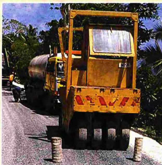
Σε κίνδυνο θέτει η κυβέρνηση τα δημόσια έργα, όπως επισημαίνουν οι κατασκευαστές

Όπως υπογραμμίζεται από την πλευρά του ΣΑΤΕ, το συνολικό ποσό οφειλών του Δημοσίου προς τις κατασκευαστικές επιχειρήσεις εκτιμάται άνω του 1,8 δισ. ευρώ, ενώ σχεδόν ένας στους τέσσερις άλλοτε εργαζόμενοι στην