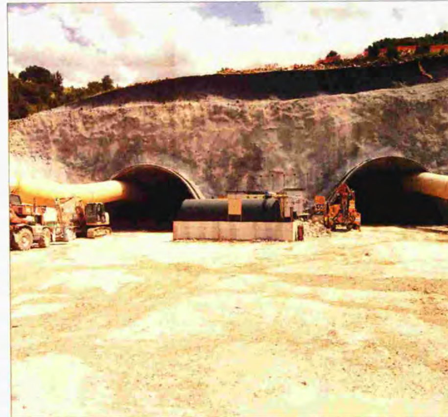
>> Σύμφωνα με τα στοιχεία της ΕΛ.ΣΤΑΤ. μεταξύ τρίτου τριμήνου 2008 - τρίτου τριμήνου 2010 είχαν χαθεί 79.400 θέσεις εργασίας από τον κλάδο, δηλαδή το 20%

τονίζει ο ΣΑΤΕ στο έγγραφο του προς τους τρεις υπουργούς. Οι κατασκευαστές αναφέρουν ότι το Δημόσιο αρνείται την εφαρμογή της δυνατότητας συμψηφισμού των απαιτήσεων με οφειλές προς το Δημόσιο και καταγγέ-