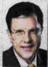
του ΓΙΩΡΓΟΥ ΑΥΓΙΑ

Ο ταν η κυρία Λαγκάρντ δήλωνε μπροστά στους εμβρόντητους δημοσιογράφους, ότι «έγινε υποτίμηση του βιοτικού επιπέδου των Ελλήνων γιατί δεν μπορούσε να γίνει υποτίμηση του ευρώ» όλοι πλέον αντελήφθησαν το μέγεθος του κακού που έχει συντελεσθεί στη χώρα.