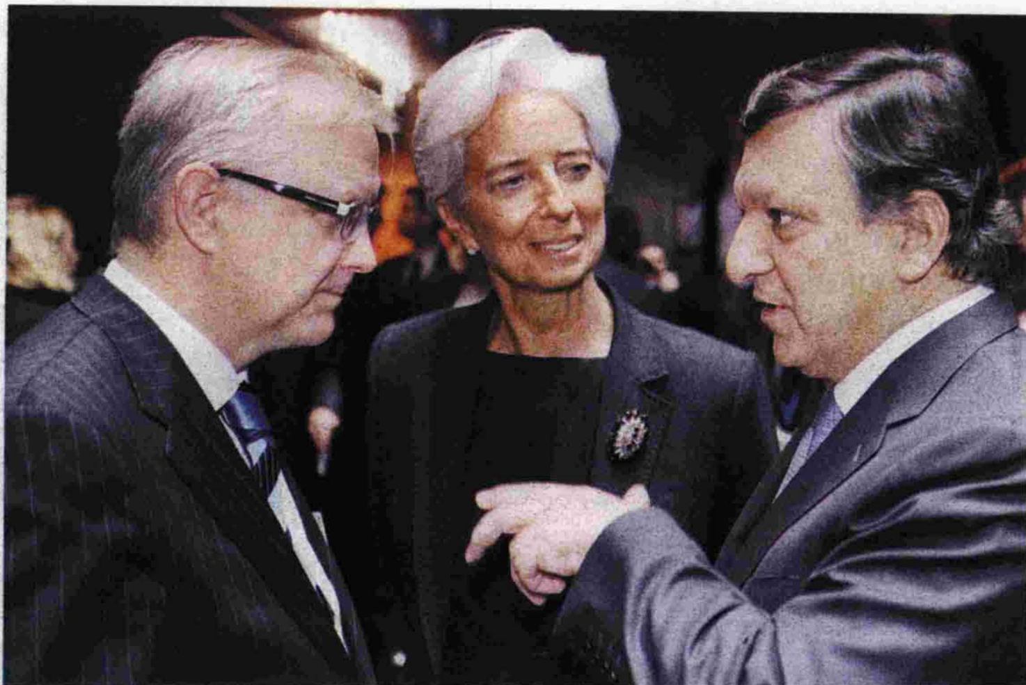
Τα λάθη της Τρούικας τροχοπέδη στην ελληνική οικονομία...