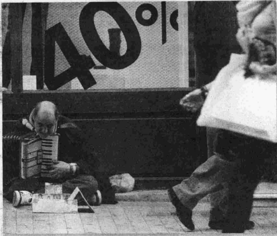
Οι οικονομικοί πειραματισμοί της Τρόικας οδήγησαν στη φτωχοποίηση τον ελληνικό λαό