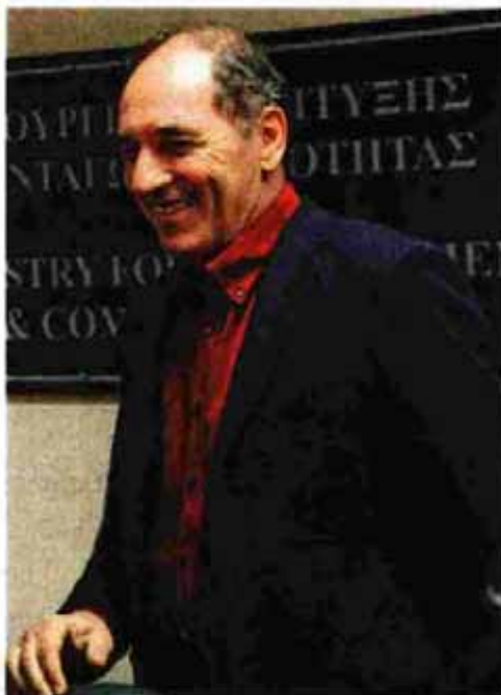
Ο υπουργός Οικονομίας, Υποδομών, Ναυτιλίας και Τουρισμού, Γιώργος Σταθάκης

Η προηγούμενη κυβέρνηση έχει υποβάλει ένα μεγαλεπήβολο πακέτο 147 έργων με προϋπολογισμό που ξεπερνά τα 40 δισ. ευρώ, το οποίο όμως χρειάζεται «κούρεμα» για να μπορεί να χρηματοδοτηθεί από κοινοτικά προγράμματα, που είναι σαφώς λιγότερα σε σχέση με το ΕΣΠΑ για τους τομείς των έργων. Θα γίνει προσπάθεια να ενταχθούν στο περίφημο πακέτο Γιούνκερ